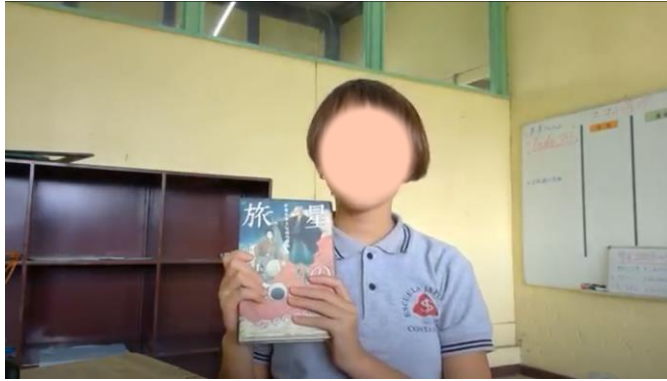
■さんからの紹介動画