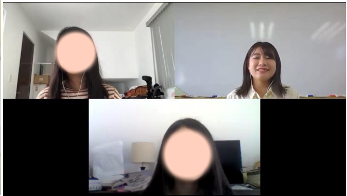
■さんへの感想動画