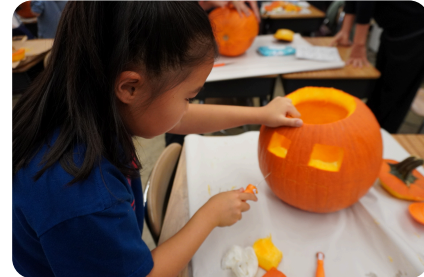
幼小中を貫く 探究カリキュラム

幼稚園・小学部・中学部が同一校舎であるという教育環境を生かし、学部間で交流しながら、探究的な学び方が自然と引き継がれていく探究スパイラルを構築します。