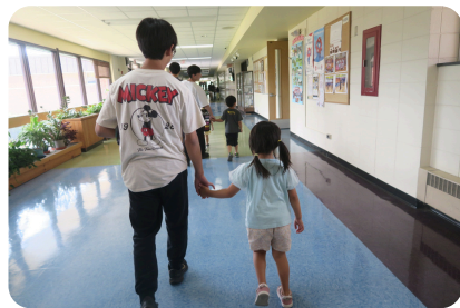
双方向的に学び合う 幼小中連携